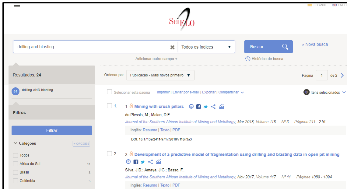
Ilustración 3: Búsqueda realizada en Scielo con la palabra clave drilling and blasting

A continuación se muestra imágenes de la búsqueda realizada con las palabras clave respectivamente: