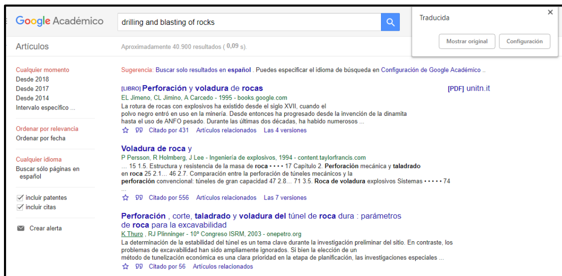
Ilustración 4: Búsqueda realizada en Google académico con la palabra clave drilling and blasting